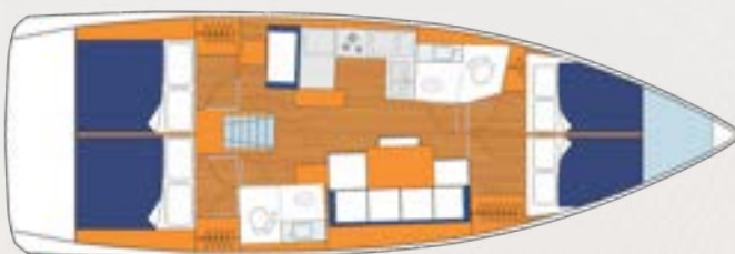
Monohull / Einrumpf-Segelyacht